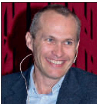
David Vann har skrevet den kritikerroste romanen «Legend of a Suicide».

Nord-Trøndelag: Markering på Stiklestad Nasjonale Kulturhus med bl.a. foredragsholdere